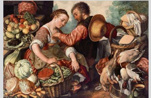
Joachim Beuckelaer, De groenteverkoopster, Antwerpen, Snijders&Rockoxhuis

Een schitterende getuige van het bloeiende marktlevens in de 16 de eeuw is Joachim Beuckelaers werk 'De groenteverkoopster', een voorloper van het marktgenre in de 17 de eeuw en een inspiratiebron voor Frans Snijders.