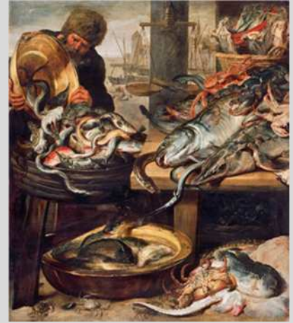
Frans Snijders, Vismarkt, Antwerpen, Snijders&Rockoxhuis