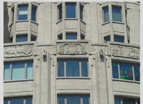
KBC Toren, detail

Vandaag staat op deze plaats de Boerentoren (KBC-toren), een gebouw in art deco. Boven de 6 de verdieping op de zijvleugels prijken bloemen- en vruchtenslingers, bloemvazen en hoornen des overvloed. Het zijn symbolen die de heropbloei na de Eerste Wereldoorlog in beeld brengen. Ook Frans Snijders alludeerde met zijn fruitstillevens en markttaferelen op de economische groei tijdens het Twaalfjarig Bestand.