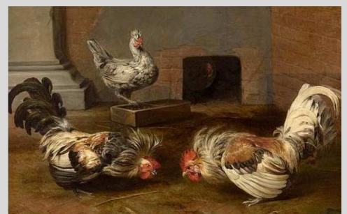
Frans Snijders, Vechtende hanen, Antwerpen, KMSKA

Op het einde van deze straat, voor je de Groenplaats opgaat, ligt rechts de Melkmarkt, die sinds de 14 de eeuw de zuivelmarkt was. In de periode van Frans Snijders werd melk omwille van zijn beperkte houdbaarheid echter weinig gedronken.