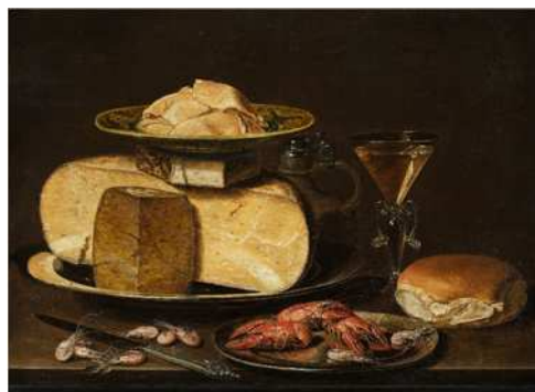
Clara Peeters, Stilleven, Antwerpen, privé-verzameling

Clara Peeters (1588 – 1621) was een buitenbeentje. Ze was een van de weinige vrouwelijke kunstschilders én een pionier in de ontwikkeling van het stilleven als genre. Ze leefde en werkte in Antwerpen. Slechts een 40-tal schilderijen zijn aan haar toegeschreven. Haar stillevens – banketjes, visschotels en bloementuilen – zijn een lust voor het oog. Mogelijks heeft ze school gelopen bij Osias Beert en kende ze ook Frans Snijders.