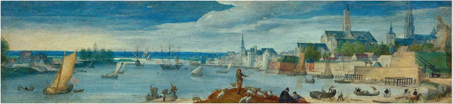
Hans Bol, Gezicht op Antwerpen, Antwerpen, Snijders&Rockoxhuis

Antwerpen beleefde een woelige 16 de eeuw. Na de Beeldenstorm en de Calvinistische periode, werd de stad in 1585 onder Spaanse voogdij geplaatst. Het nieuwe katholieke stadsbestuur beval het herstel en de herinrichting van de kerken. Om financiële redenen kon hier niet onmiddellijk werk van worden gemaakt.