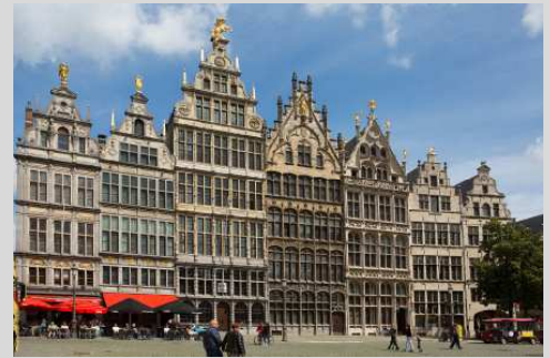
Café Den Engel & huis Spaengien

Een vrijmeester is een lid van de gilde die op zelfstandige basis werkt.