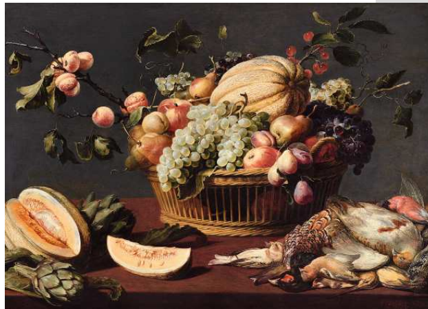
Frans Snijders, Stilleven, Antwerpen, Snijders&Rockoxhuis