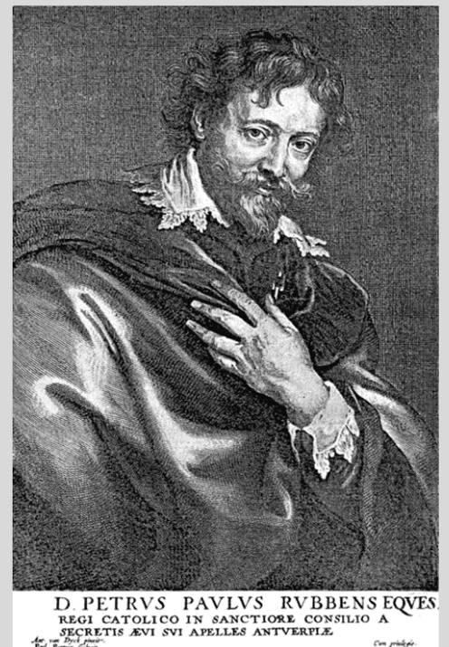
Paulus Pontius naar Anthony van Dyck, Portret P.P. Rubens, Antwerpen, Sniijders&Rockoxhuis , Ets

Peter Paul Rubens (1577-1640) was een Antwerpse schilder en tekenaar. Hij was de belangrijkste zeventiende eeuwse kunstenaar uit Noord-Europa. Bepalend in zijn loopbaan is zijn verblijf in Italië van 1600 tot 1608. Vooral Titiaan (Ca. 1485/90-1576) en Tintoretto (1519-1594) drukken hun stempel op zijn schilderijen. Dit uit zich in de dramatische compositie en het kleur, licht- en ruimtegebruik. Ook het clair-obscur van onder andere Caravaggio (1571-1610), de monumentale beeldhouwwerken van Michelangelo (1475-1564) en het werk van Rafaël (1483-1520) hebben invloed gehad op de kunst van Rubens. Rubens was een echte hofschilder en omwille van zijn vernuft werd hem gevraagd om diplomatieke reizen te ondernemen. Hij was bijzonder succesvol als kunstenaar en kon voor de talloze opdrachten terugvallen op een atelier met uitstekende medewerkers. Bekende kunstenaars zoals Anthony van Dyck (1599-1641) en Frans Sniijders (1579-1657) passeren er de revue. Rubens was een alleskunner en vervaardigde monumentale altaarstukken, grote mythologische cycli, portretten, dramatische dierstukken, landschappen, architectuurplannen, grafiek en tapijontwerpen.