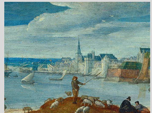
Hans Bol, Gezicht op Antwerpen, Antwerpen, Snijders&Rockoxhuis, detail

In de 17 de eeuw was Antwerpen de voornaamste leverancier van vis voor de Zuidelijke Nederlanden. In die tijd bestond de Antwerpse vismarkt uit een binnen- en een buitenvismarkt.