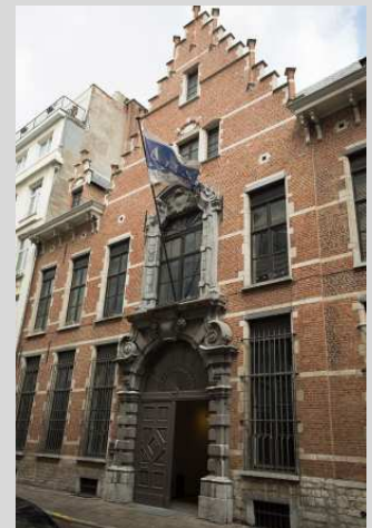
Huis Den Bock

Jan Brueghel en Frans Sniijders waren goed bevriend. Hoewel Frans Sniijders in de leer ging bij Pieter Brueghel II, de jongere broer, was de ontmoeting met Jan Brueghel veel belangrijker. Jan had meer dan zijn broer aandacht voor het detail, een precisie waarmee ook Sniijders getalenteerd was. Jan werd dan ook Frans' mentor.