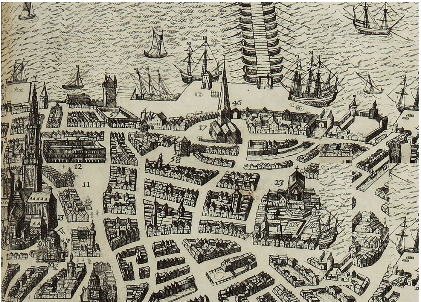
Theodoor van Thulden, Antverpia, 1635, gravure (detail omgeving Steen)