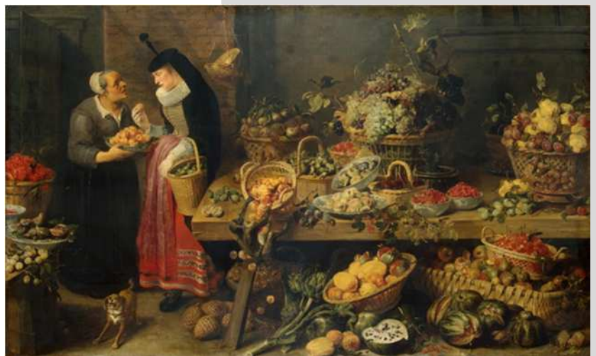
Frans Snijders, Fruitmarkt, St-Petersburg, Hermitage

Frans Snijders was een meester in het subtiel weergeven van druiven en wijnranken.