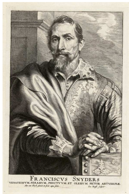
Lucas Vorsterman naar Anthony van Dyck, Portret van Frans Snijders

Frans Snijders of Franchoijs zoals hij officieel signeerde, heeft vooral naam gemaakt als stilleven- en dierenschilder tijdens de eerste helft van de 17 de eeuw. Zijn scherpe oog, zijn kennis van de natuur en zijn originele composities vormden voor vele kunstenaars een inspiratiebron tot diep in de 19 de eeuw. Frans Snijders werd in 1579 in Antwerpen geboren en is er in 1657 overleden. Hij woonde vanaf 1622 naast Nicolaas Rockox in de Keizerstraat.