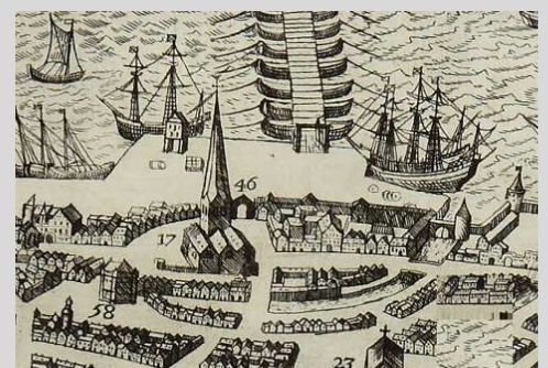
Theodoor van Thulden, Antwerpen, gravure, detail van de burcht