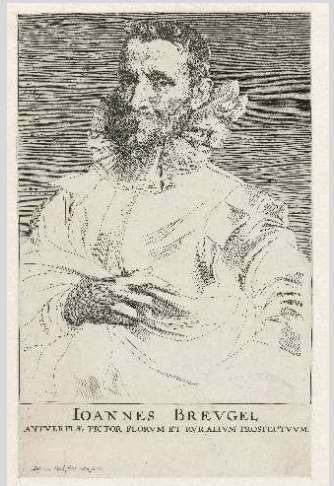
Anthony van Dyck, Jan Brueghel, Kopergravure

Jan Brueghel (1568 – 1625) was de zoon van Pieter Bruegel de Oude en de broer van Pieter Brueghel de Jonge. Zijn vader stierf een jaar na zijn geboorte.