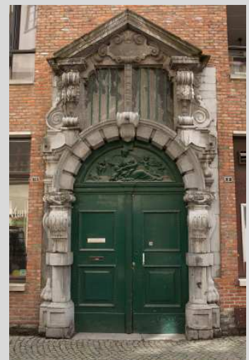
Poortgebouw Oude Beurs