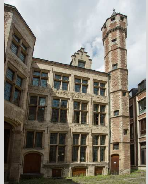
Pagddertoren via Wisselstraat 6

Een Pagaddertoren is een uitkijktoren die door reders werd gebruikt om hun schepen te zien aankomen. Gelet op de beperkte ruimte werden kleine mensen in de toren gestuurd. Wie het eerste een schip zag, kon dit claimen en er tol of accijns door verdienen. Het woord 'Pagadder' is afgeleid van het Spaanse woord 'Pagadores'. Dit waren de betaalmeesters van de Spaanse troepen, soldaten te klein van gestalte om aan gevechten deel te nemen. Kinderen in het Antwerpse worden daarom pagadders genoemd.