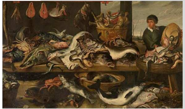
Frans Snijders, In de viswinkel , Antwerpen, KMSKA

Het alternatief voor vlees was vis. Haring, mosselen en kabeljauw waren voor de armen bestemd, de populairste vissoorten voor de rijken waren onder meer steur, forel, snoek en oesters.