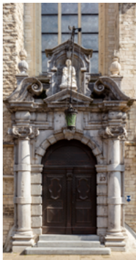
△ Keizerstraat 21-23