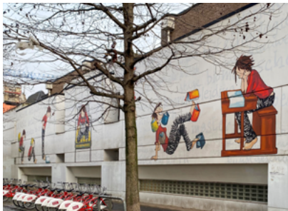
△ Gevel van de alma van de universiteit