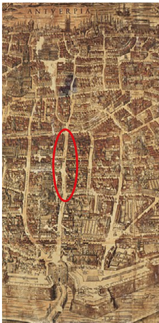
Bononiensis, Virgilius (tekenaar), Coppens van Diest, Gillis (drukker), Plan van Antwerpen, MPM.V.VI.01.002, Collectie Stad Antwerpen, Museum Plantin-Moretus, detail met Via Caesarea (Keizerstraat)