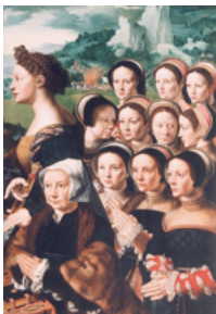
Jan van Hemessen, Adriaan Rockox sr. en Catharina van Overhoff met hun dertien kinderen, Antwerpen, Sint-Jacobskerk