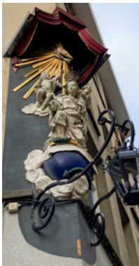
△ Keizerstraat 73

Overal in de stad zijn Mariabeelden te zien. Ze verwijzen in de eerste plaats naar de patroonheilige van Antwerpen, Onze-Lieve-Vrouw.