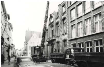
△ Hotel de Fraula, foto, Antwerpen, Felixarchief