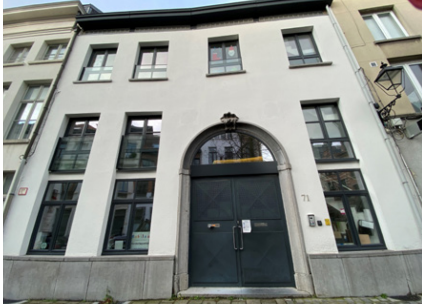
△ Keizerstraat 71

in 1844. Het gerenoveerde complex maakt vandaag deel uit van een sociaal wooncomplex van de huisvestingsmaatschappij Huisvesting Antwerpen, ontworpen in 1986 en voltooid in 1991.