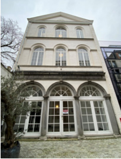
△ Keizerstraat13, binnen

Zoals al eerder vermeld, hadden Adriaan Rockox en zijn echtgenote Catharina van Overhoff dertien kinderen. Het huis op nummer 11 werd dan ook al snel te klein.