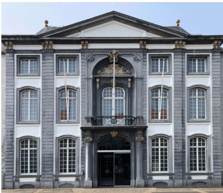
△ Gevel van Hotel de Fraula, opnieuw opgetrokken op de Wapper