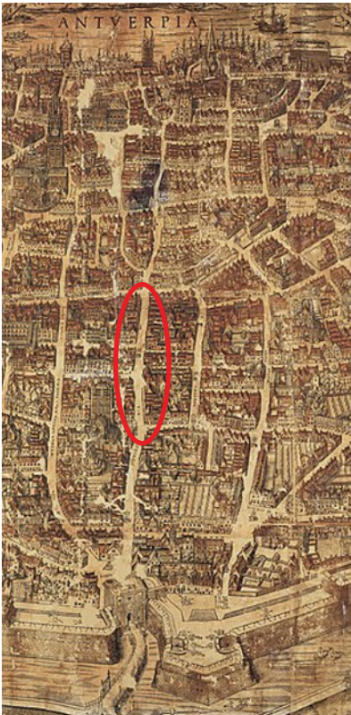
Virgilius Bononiensis (tekenaar), Gillis Coppens van Diest (drukker), Plan van Antwerpen, MPM.V.VI.01.002, Collectie Stad Antwerpen, Museum Plantin-Moretus, detail met Via Caesarea (Keizerstraat)

De Keizerstraat heeft iets plechtigs in haar naam, en dat was ook zo in Rockox' tijd. De straat was toen een van de residentiële buurten even buiten de stadskern. De Keizerstraat was fysiek ook afgesloten van het centrum door de Minderbroedersrui. De Via Caesarea , zoals de Keizerstraat op de Bononiensis-kaart uit 1565 (Antwerpen, Museum Plantin Moretus) wordt genoemd, was al sinds lang een van de invalswegen naar het stadscentrum. De oudste vermeldingen van deze straat dateren van het einde van de dertiende eeuw. Het is echter niet duidelijk of ze zo zou zijn genoemd naar een op dat moment regerende keizer. En hoe de straat eruitzag vóór 1379 – het jaar waarin een grote brand alle huizen verwoestte – weten we niet. Wat we wel weten is dat vele Antwerpse straten ongeplaveid bleven, maar de Keizerstraat was al sinds de tweede helft van de veertiende eeuw voorzien van straatstenen.