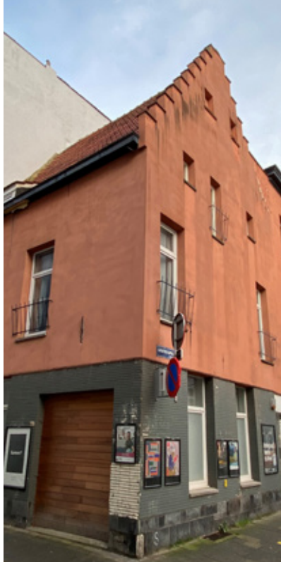
△ Keizerstraat 39