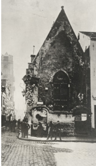
△ Gevel van de Broodjeskapel, foto, Antwerpen