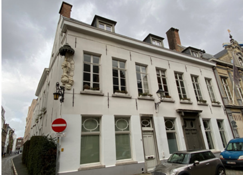
△ Keizerstraat 5 - 7