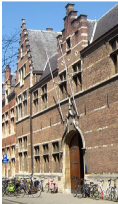
△ Prinsstraat 13

De Prinsstraat werd in 1516 door Aert van Liere geopend op een deel van de toenmalige raamhoven. Van Liere was buitenburgemeester van Antwerpen en overgrootoom van Nicolaas Rockox. Hij liet er het befaamde Hof van Liere bouwen, dat in 1607 in gebruik werd gegeven aan de jezuïeten die er hun Latijnse school organiseerden. Vandaag is het Hof van Liere het hart van de Universiteit Antwerpen. De straat heette aanvankelijk Straat van Liere , maar is later in de zestiende eeuw Prinsstraat geworden, vermoedelijk naar aanleiding van het bezoek van de toekomstige Keizer Karel aan het Hof van Liere , nog in zijn hoedanigheid als prins.