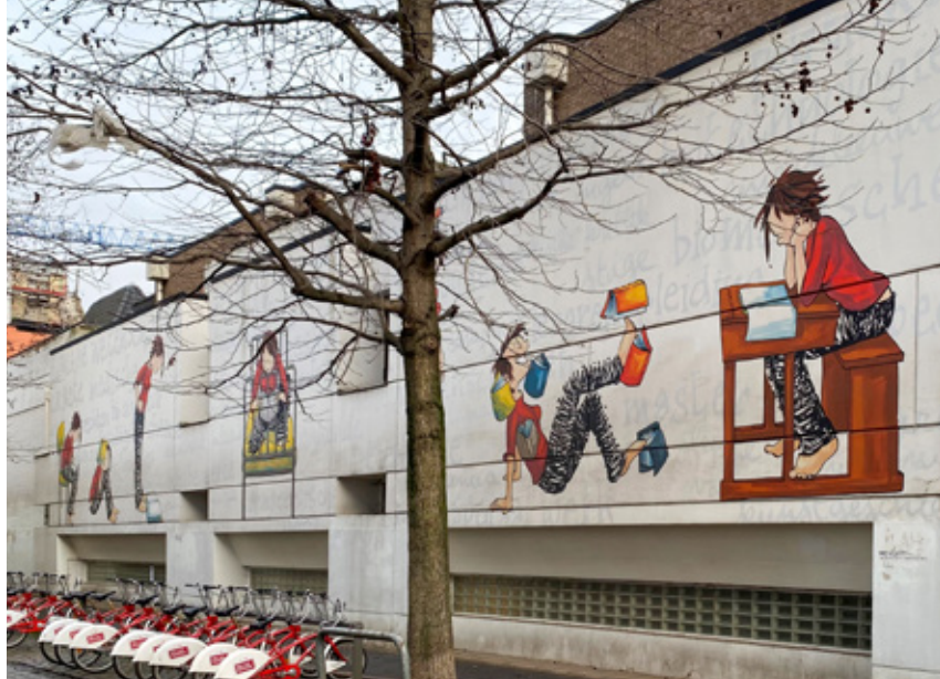
△ Gevel van de alma van de universiteit

Tussen de Gratiekapelstraat en de Koningstraat wordt de klassieke gevellijn van de straat andermaal onderbroken op het nummer 45 . Het voormalige Hotel de Fraula in régencestijl dat in 1738-39 was gebouwd door Jan Pieter van Bourscheit de Jonge (Antwerpen, 1699-1768), moest in 1963 plaats ruimen voor het universiteitsrestaurant en studentenverblijven, die in 1972 werden opgetrokken door architect J. Cols. Het hotel en het gebouw ernaast huisvestten vanaf 1840 het jezuïetencollege. De gevel van het Hotel de Fraula werd in 1986 opnieuw opgetrokken tegen de nieuwbouw van de toenmalige Generale Bank op de Wapper. Opdrachtgever voor het Hotel de Fraula was burggraaf Thomas Augustin Joseph de Fraula