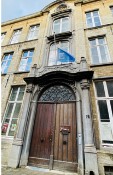
◁ Keizerstraat 15