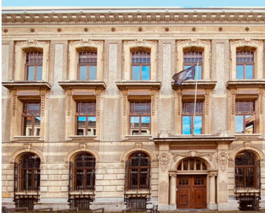
△ Keizerstraat 14

We hebben nu wel het imposante rijk van de familie Rockox-Perez gehad, ondernemers, internationaal netwerk, patriciërs, in de adelstand verheven ... maar ook de rest van de straat is boeiend genoeg om nog even door te gaan. We keren enkele stappen terug en bekijken het tegenoverliggende huis.