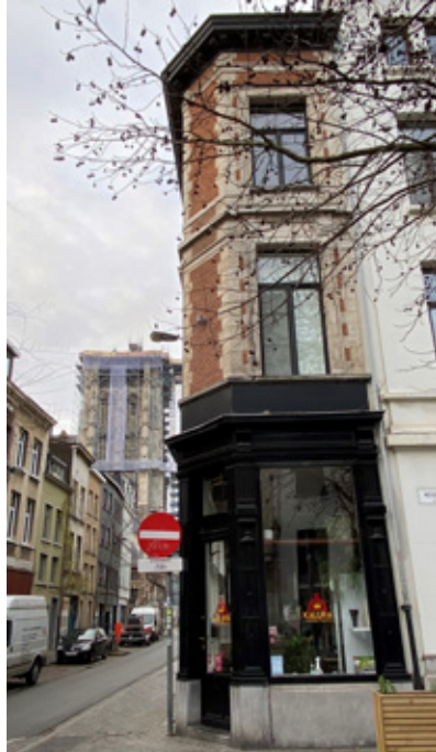
△ Hoek Keizerstraat / Prinsesstraat