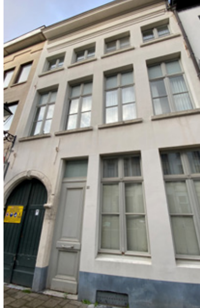
△ Keizerstraat 67 (69)

De Koningstraat werd ca. 1527 geopend als verbinding tussen de Keizerstraat en de Prinsstraat in het kader van de verdere stadsuitbreiding door Gilbert van Schoonbeke (1519-1556). Diens zoon, Gilbert van Schoonbeke de Jonge, was door aankoop eigenaar geworden van de huizen in deze straat en ook van twee blekerijen op de hoeken van de Prinsstraat en de Koningstraat. Hij hervatte de bouw van de straat, die zonder enige link Koningstraat werd genoemd. Hij liet er huizen bouwen die namen kregen van beroemde Bijbelse koningen zoals David , Balthazar , Melchior , Gaspar en Salomon en zo was de naam van de straat gewettigd.