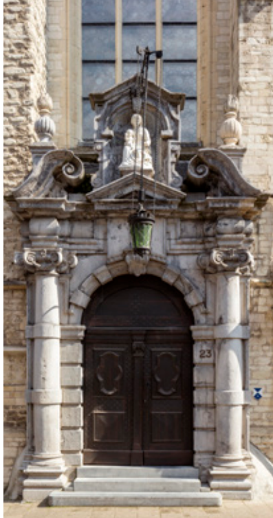
△ Keizerstraat 21-23