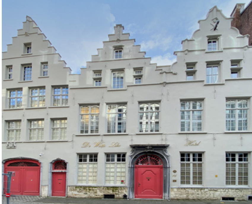
△ Keizerstraat 16-18

stallingen in de Keizerstraat door de architect Ernest Stordiau verbouwen en uitbreiden tot kantoren. In opdracht van de handelsmaatschappij Comptoir Commercial Anversois die minstens vanaf 1903 in het complex gevestigd was, werden de gebouwen in de Keizerstraat vervangen door het prestigieuze kantoorgebouw dat wij vandaag zien. Let op de schitterende toegangspoort, geflankeerd door Ionische zuilen, bekroond met een guirlande en verrat tussen pilasters met rijk versierde medaillons. Dit gebouw behoort vandaag tot de Universiteit Antwerpen.