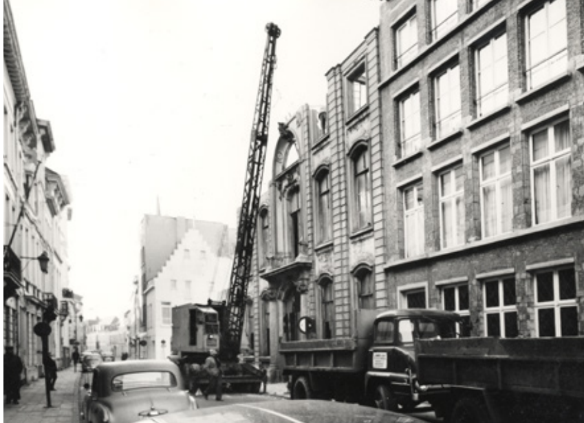
△ Hotel de Fraula, foto, Antwerpen, Felixarchief