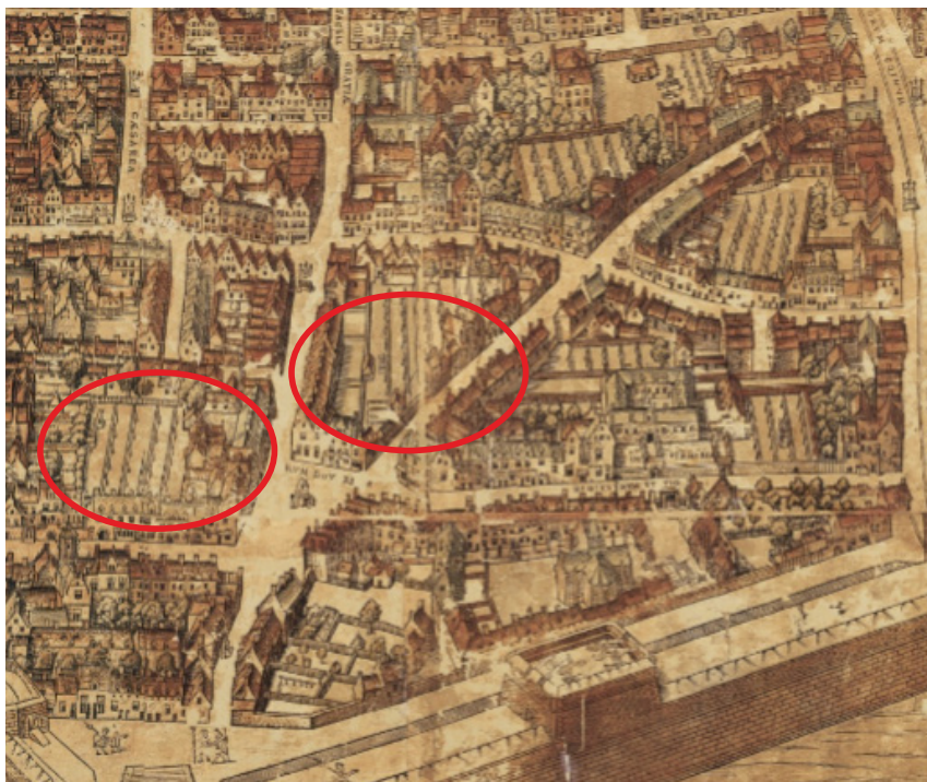
Virgilius Bononiensis (tekenaar), Gillis Coppens van Diest (drukker), Plan van Antwerpen, MPM.V.VI.01.002, Collectie Stad Antwerpen, Museum Plantin-Moretus, detail, in 1565 zijn nog enkele plekken door raamvelden ingenomen, zoals in de buurt van de Ossenmarkt of opzij van de Pieter van Hobokenstraat.