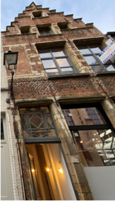
△ Keizerstraat 36

Refereert de woning de Rosenhoedt op nummer 36 aan den Paternoster ?