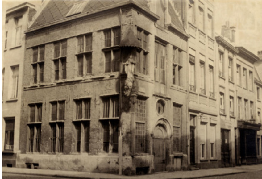
△ Keizerstraat 51-55

Nummer 51-55 , waarvan nummer 51 het voormalige huis Sint-Anna Waar nu een troosteloos woningblok staat, stond op de hoek van de Keizerstraat en de Koningstraat het zeventiende-eeuwse huis Sint-Anna , een naam die andermaal verwijst naar de textielindustrie. Aan het begin van de jaren 1960 werd het huis samen met nog andere panden afgebroken. Alweer een triest voorbeeld van de kaalslag die Antwerpen teisterde tussen de jaren 1960 en 1980, waarbij de Keizerstraat een slachtoffer werd van het falende stedenbouwkundige beleid van de stad. Aktiegroepen probeerden de sloop van waardevolle panden tegen te houden, maar het was uiteindelijk graaf Daniël Le Grelle die als gemeenteraadslid (1959-1988) de stad een geweten schopte. Zijn aanklacht