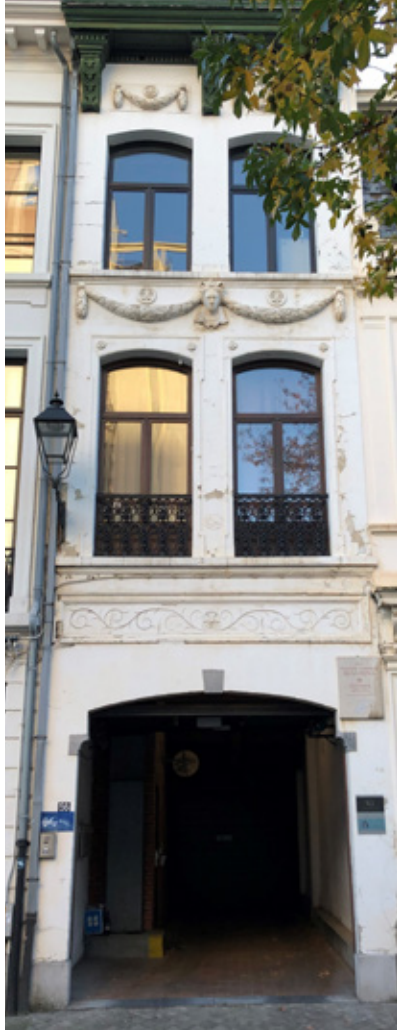
△ Keizerstraat 56