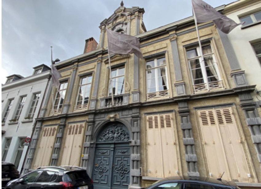
△ Keizerstraat 9