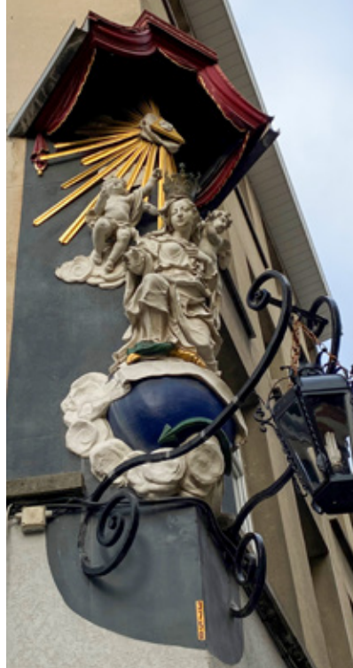
△ Keizerstraat 73