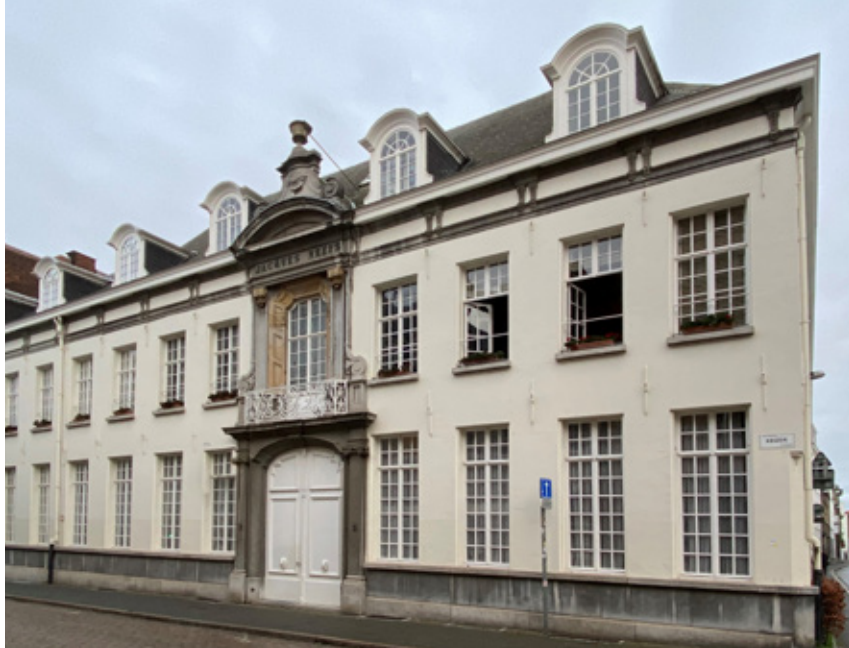
△ Keizerstraat 3