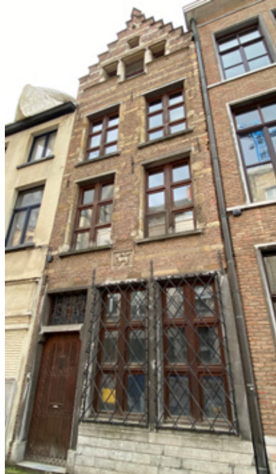
△ Keizerstraat 24