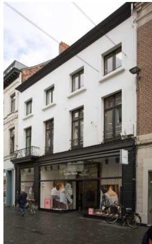
Korte Gasthuisstraat 17