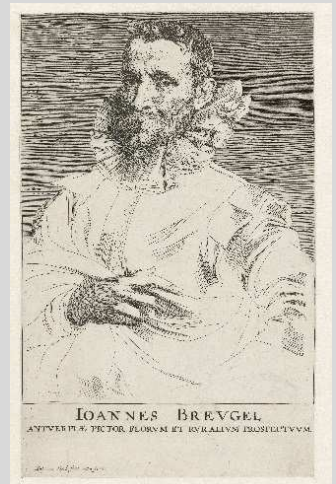
Anthony van Dyck, Jan Brueghel, Kopergravure

In 1589 trok hij naar Italië, waar hij in Milaan werkte voor kardinaal Federico Borromeo. Na zijn terugkeer naar Antwerpen werd hij, naast Peter Paul Rubens, één van de meest gerenommeerde schilders en werd benoemd tot hofschilder van de aartshertogen Albrecht en Isabella. Jan Brueghel die naam maakte als bloemen en landschapsschilder, stierf op 57 jarige leeftijd aan cholera.