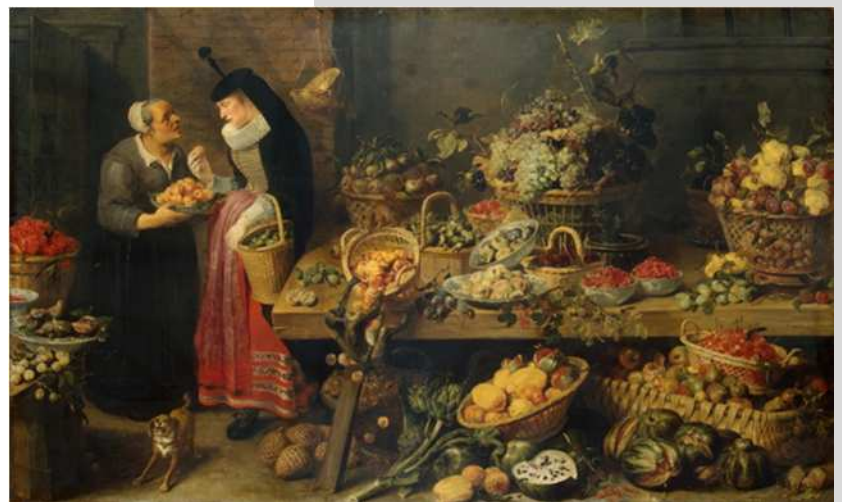
Frans Snijders, Fruitmarkt, St-Petersburg, Hermitage

Frans Snijders was een meester in het subtiel weergeven van druiven en wijnranken.