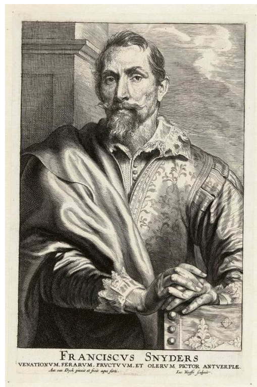
Lucas Vorsterman naar Anthony van Dyck, Portret van Frans Snijders

Frans Snijders of Franchoijs zoals hij officieel signeerde, heeft vooral naam gemaakt als stilleven- en dierenschilder tijdens de eerste helft van de 17 de eeuw. Zijn scherpe oog, zijn kennis van de natuur en zijn originele composities vormden voor vele kunstenaars een inspiratiebron tot diep in de 19 de eeuw. Frans Snijders werd in 1579 in Antwerpen geboren en is er in 1657 overleden. Hij woonde vanaf 1622 naast Nicolaas Rockox in de Keizerstraat.