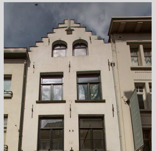
Wiegstraat 16 (rechterkant van de straat)

De Wiegstraat maakte aan het begin van de 13 de eeuw deel uit van de vestenlijn die het nieuwe stadskwartier rond de O L Vrouwekerk omwalde. De straat heeft zijn naam ontleend aan het huis nr 16, 't Peerd in de Wieghe . Dit is een woning met een kern uit de 16 de eeuw en een beschermd bovendeel en dak. De oorspronkelijke naam van het huis is van de gevel verdwenen maar refereerde aan een voormalig bordeel of aan een plaats waar hoogzwangere vrouwen anoniem hun kind konden baren.