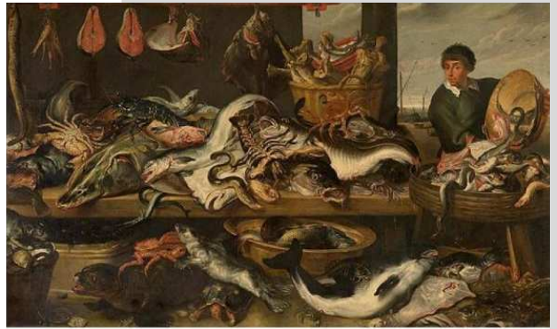
Frans Snijders, In de viswinkel , Antwerpen, KMSKA