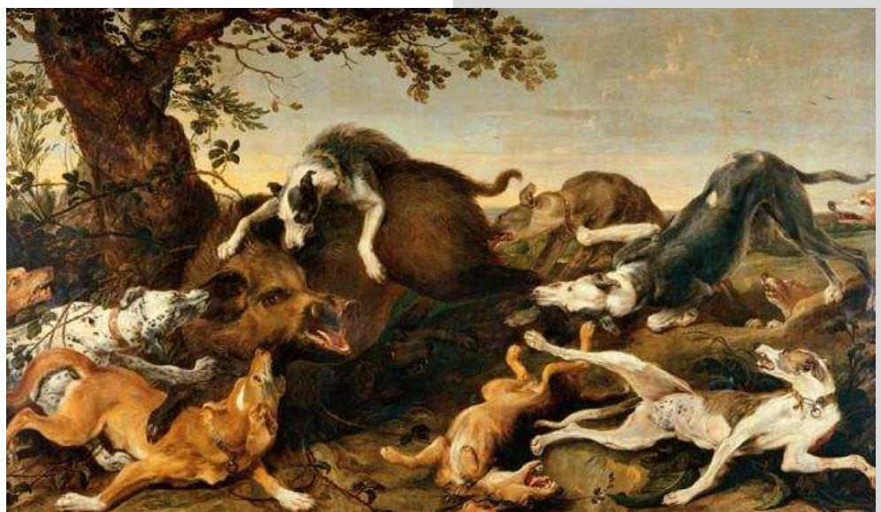
Frans Snijders, Jacht op een everzwijn, Antwerpen, Snijders&Rockoxhuis