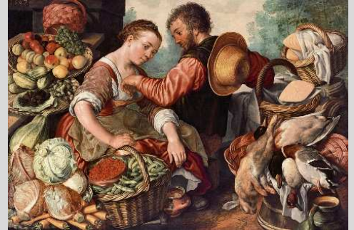
Joachim Beuckelaer, De groenteverkoopster, Antwerpen, Snijders&Rockoxhuis

Een schitterende getuige van het bloeiende marktlevens in de 16 de eeuw is Joachim Beuckelaers werk 'De groenteverkoopster', een voorloper van het marktgenre in de 17 de eeuw en een inspiratiebron voor Frans Snijders.