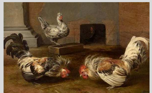
Frans Snijders, Vechtende hanen, Antwerpen, KMSKA

Op het einde van deze straat, voor je de Groenplaats opgaat, ligt rechts de Melkmarkt, die sinds de 14 de eeuw de zuivelmarkt was. In de periode van Frans Snijders werd melk omwille van zijn beperkte houdbaarheid echter weinig gedronken.